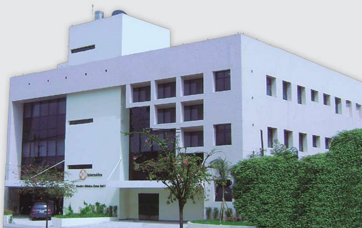
Centro Clínico Zona Sul I

Em breve o novo Hospital da Intermédica em Campinas, com estrutura moderna para atendimento Hospitalar, Pronto-Socorro e Maternidade.